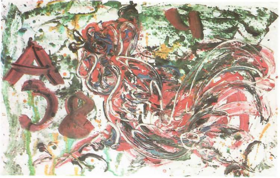
زيتية على كرتون Oil on Cardboard