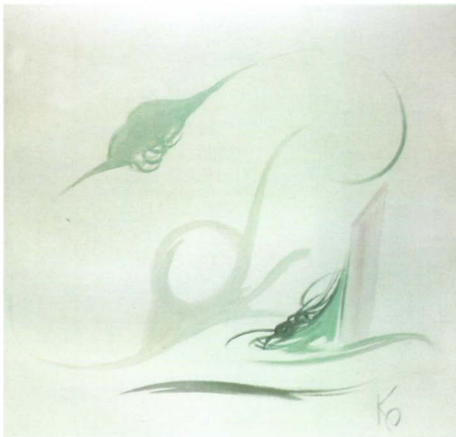
زیتة علی کرتون Oil on Cardboard