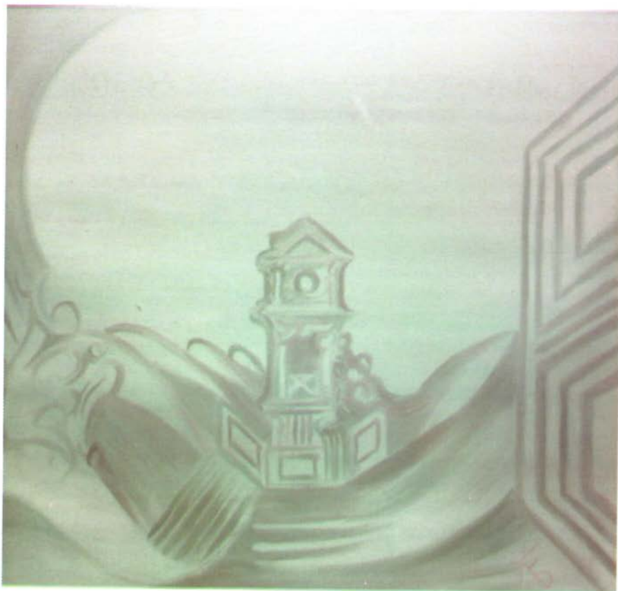
زيتية على كرتون Oil on Cardboard