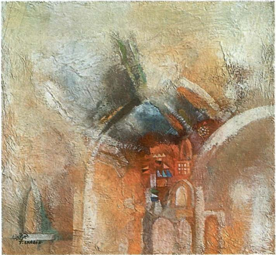
Gouache and mixed media on cardboard