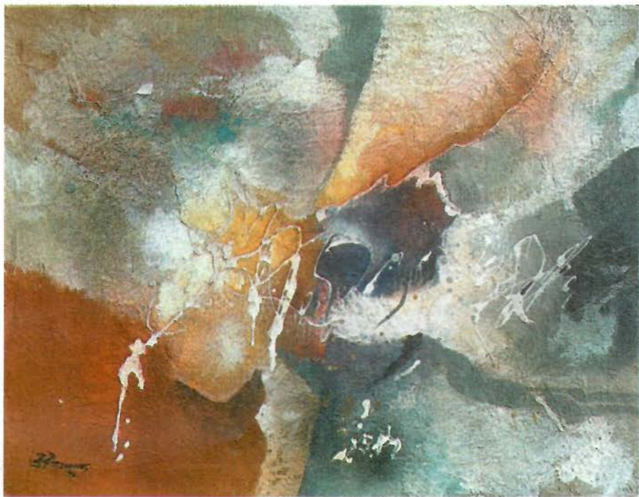
Gouache and mixed media on cardboard