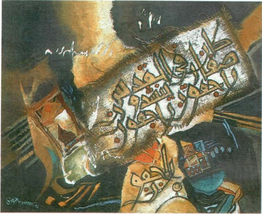
Gouache and mixed media on fabric