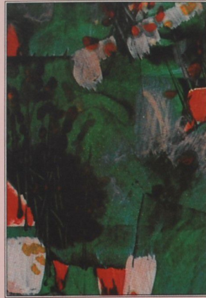
من لوحات حسين دوسة